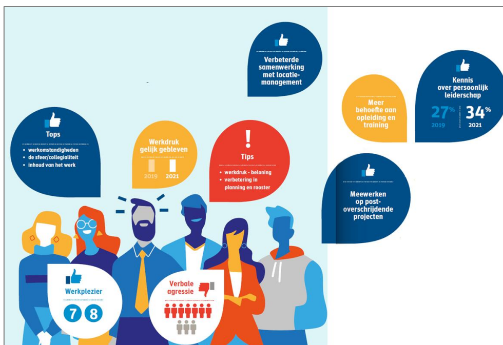
FIGUUR 4 : DE HOOFDRESULTATEN VAN HET MBO 2021

Op basis van de resultaten waren er 4 thema's die zich richten op personeelsbehoud en is ook toegelicht wat de aanpak is geweest.